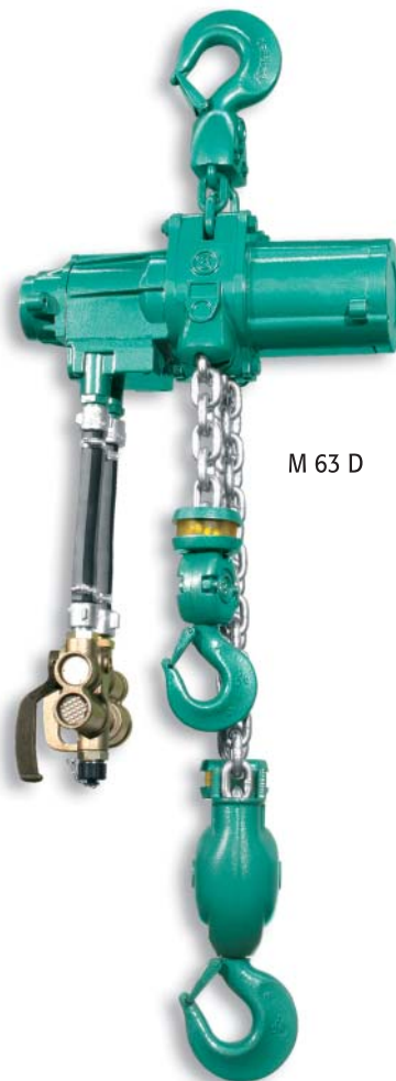
M 63 D