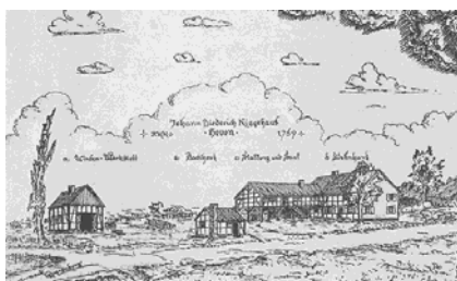
Neuhaus-Kotten um 1769