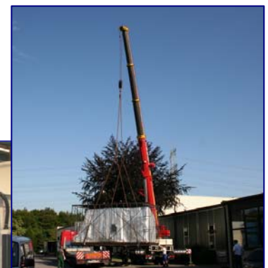
Anlieferung eines von drei Bearbeitungszentren.