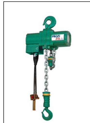
PROFI 3 TI

und die Abluft kühlt das Hebezeug. Daher sind Druckluft-Hebezeuge für „heiße“ Einsatzbereiche wie in Gießereien oder im Stahlwerk prädestiniert. Im Vergleich dazu müssen Elektromotore zur Abkühlung Ruhepausen einlegen. Wenn elektrische Energie bevorzugt wird, müssen höhere Anschaffungskosten und regelmäßige Wartungen durch qualifiziertes Fachpersonal in Betracht gezogen werden. JDN-Druckluft-Hebezeuge haben einen modularen Aufbau, und die nur wenigen Bauteile sind sehr gut zugänglich und einfach zu warten.